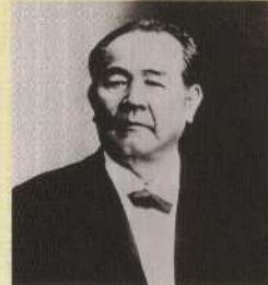
▲渋沢栄一