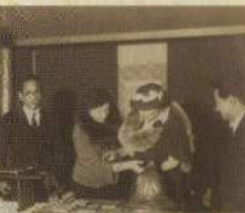
▲保己一の小さな像に親しげに触れているヘレン・ケラー